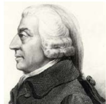
Adam Smith, schottischer Moralphilosoph, 1723–1790, gilt als Begründer der klassischen Volkswirtschaftslehre.

Das Wirtschaftsparadigma vom Adam Smith ist immer noch Mainstream. Jedoch hat die von ihm geforderte „Freiheit des Marktes“ zur Entwicklung von Kartellen und Monopolen geführt. Auch der Nobel-