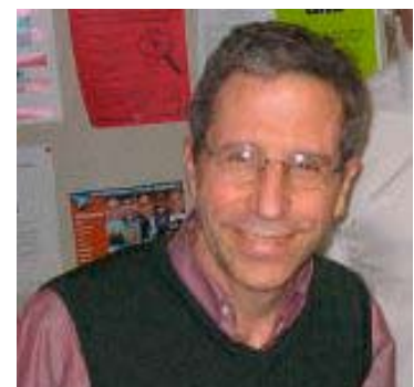
Eric Stark Maskin, *1950, ist amerikanischer Mathematiker, Wirtschaftswissenschaftler und Nobelpreisträger.

Vortrag: http://video.ias.edu/Global-Markets-and-Inequality