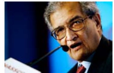
Amartya Kumar Sen, *1933, indischer Wirtschaftswissenschaftler und Wirtschaftsphilosoph. Zu seinen Forschungsschwerpunkten gehören die Problematik der Armut und die Wohlfahrtsökonomie. Er ist Professor der Wirtschaftswissenschaften an der Harvard University in Cambridge (Massachusetts). 1998 erhielt Sen den Nobelpreis für seine Arbeiten zur Wohlfahrtsökonomie, zur Theorie der wirtschaftlichen Entwicklung und zum Lebensstandard.

Im Sinne des Nobelpreisträgers Amartya Sen kann das letzte Entwicklungsziel nur die größtmögliche Freiheit des Menschen sein. Sen spricht von fünf Arten instrumenteller Freiheiten, die die Verwirklichungschancen von Individuen fördern und erweitern können. Diese sind politische Freiheiten, ökonomische Einrichtungen, soziale Chancen, Transparenzgarantien und soziale Sicherheit – d.h. wir müssen Wachstum neu definieren. Nicht Wachstum um jeden Preis, sondern qualitatives Wachstum unter Berücksichtigung sozialer Chancen und umweltverträglicher Technologien lautet das Gebot der Stunde.